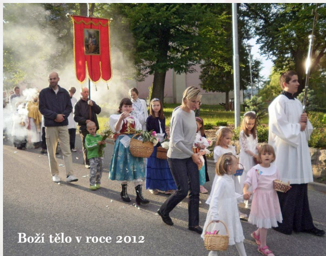
Boží tělo v roce 2012