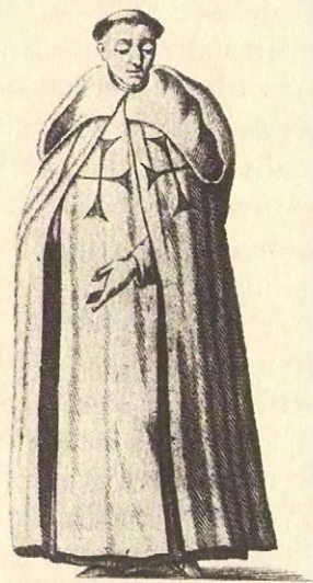
Trinitář v hábitu

Jsou katolickým řádem s oficiálním názvem Řád Největější Trojice pro vykupování zajatých otroků. Jeho zakladateli byli sv. Felix z Valois (1127–1212) a sv. Jan z Mathy (1160–1213). První klášter vznikl nedaleko Paříže a rychle se šířil do Španělska, Itálie, Portugalska, Německa, Rakouska, Polska a jiných zemí. Za dobu své existence vykoupil asi 1 400 000 otroků. Od konce 18. století byly jeho kláštery v jednotlivých zemích rušeny a zdálo